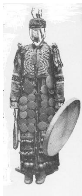
Sjamane en dochter van stamhoofd uit Mongolië, kostuum uit 1932 Afb. uit The Language of MA , dl I h 4, 102 [[1.4.92]; Venus is geen Vamp , afb. op p. 99

Esther Jacobson wijst - op basis van Russische literatuur over het Siberische sjamanisme - op pre-sjamanistische familie-culten onder leiding van vrouwen; in het latere sjamanisme gaat het mannelijke gaan domineren. 8