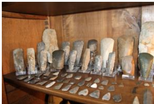
Vuursteenvondsten uit de Oude Steentijd uit de heuvels bij de Kaap uit de collectie van Huub Spronck.

In de heuvels van het Savelsbos zit veel vuursteen. Al in de Oude Steentijd wordt hier vuursteen gewonnen. De kaart hierboven toont een vuursteenmijn in de buurt van Sint Geertruid uit de Nieuwe Steentijd 3950-3650 BC. Vuursteen of silex of flint of keisteen is een gesteente dat vaak in klompen in de kalksteen wordt aangetroffen. Men maakt er in de Oude Steentijd schrapers, bijlen, stekers en figurines van. Het is in de Oude én Nieuwe Steentijd een zeer gewild materiaal omdat het scherp is en als mes gebruikt kan worden.