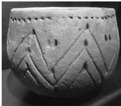
Aardewerken pot uit de LBK-cultuur met drie V-lijnen;

De Bandkeramiekers. Op de heuvels van het Savelsbos wordt zoals gezegd ook in de Nieuwe Steentijd vuursteen gewonnen. Het is de tijd van de oudste landbouwcultuur van Lineaire Bandcultuur of LBK-cultuur (5500-4900 BC). 1 Men wint vuursteen in de heuvels van het Savelsbos. De LBK-cultuur heeft zich vanuit Oost-Europa via de strook lössgrond vanuit het oosten naar het westen verplaatst. Deze cultuur heeft zich vanuit de monding van de Donau naar het westen verplaatst. De mensen van deze cultuur bereiken de rivieren de Rijn en de Maas en verspreiden zich ook in België en Zuid-Limburg. 2 Kenmerkend zijn de grootfamiliehuizen en de aardewerkenpotten met V-vormige graveringen.