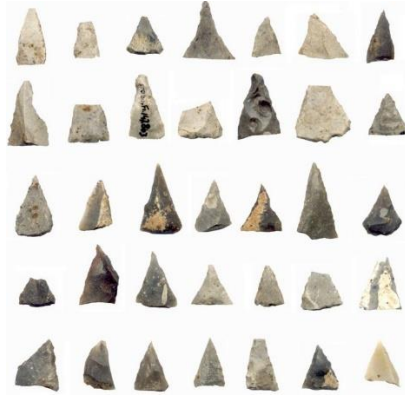
Vuursteen uit de tijd van de lineaire bandkeramiek te Geleen, 5500=4900 v. Chr.

De Bandkeramiekers. Op de heuvels van het Savelsbos wordt zoals gezegd ook in de Nieuwe Steentijd vuursteen gewonnen. Het is de tijd van de oudste landbouwcultuur van Lineaire Bandcultuur of LBK-cultuur (5500-4900 BC). 1 Men wint vuursteen in de heuvels van het Savelsbos. De LBK-cultuur heeft zich vanuit Oost-Europa via de strook lössgrond vanuit het oosten naar het westen verplaatst. Deze cultuur heeft zich vanuit de monding van de Donau naar het westen verplaatst. De mensen van deze cultuur bereiken de rivieren de Rijn en de Maas en verspreiden zich ook in België en Zuid-Limburg. 2 Kenmerkend zijn de grootfamiliehuizen en de aardewerkenpotten met V-vormige graveringen.