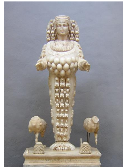
Artemis van Efese

De culturele lagen in de iconografie van Artemis van Efese. In Artemis van Efese vloeien allerlei culturele lagen samen. Zij is patrones van de wilde natuur: altijd verbonden met de wateren en de ongerepte natuur. Zij werd vereerd in een zwarte steen. Vandaar dat haar gezicht soms nog zwart is. In haar langgerekte strakke gestalte kom je ook de schematische boom of heilige paal tegen waarin zij oorspronkelijk vereerd werd. Allerlei dieren houden haar gezelschap. De hinds aan weerskanten herinneren aan de tijd dat de grote moeder nog ervaren werd in de hinde met het grote gewei dat zich vertakte als een heilige boom, de stamboom van de familie. De bijenkoningin, de leeuw en leeuwin, de koe en de stier; kortom allerlei dieren maken deel uit van haar entourage en nestelen zich op of om haar beeltenis. Haar iconografie of beeldtaal is dus opgebouwd uit motieven uit de minerale wereld (steenverering) en uit de planten- en dierenwereld. Dan tot slot zijn er de kosmische symbolen van de dierenriem, de maan en de sterren die verwerkt worden in haar sieraden, kleding en hoofdtooi. Artemis is Moeder van de kosmos en de aarde.