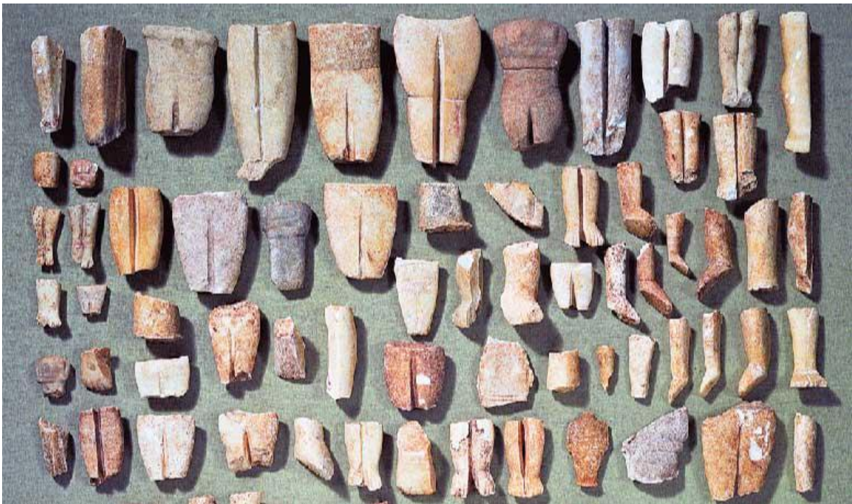
'The Keros Hoard'. De gebroken figurines uit de Noordput verzameld door Peggy Sotirakopoulou.

Peggy Sotirakopoulou heeft zich de moeite getroost de stukken, die inmiddels over de wereld verspreid waren, te achterhalen en in kaart te brengen. Zo ontstaat de 'Keros-hoofd' of Keros verzameling van 350 delen van figurines. 3 Maar Renfrew vermoedt dat er meer te vinden is op het eiland Keros en zijn intuïtie blijkt juist. Met het prijzengeld herstart hij het onderzoek op Keros tussen 2006 en 2008. In dit Cambridge-Keros Project boekt hij opmerkelijke resultaten, vandaar ook deze