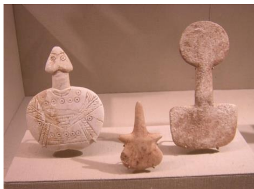
Diverse semi-abstracte figurines