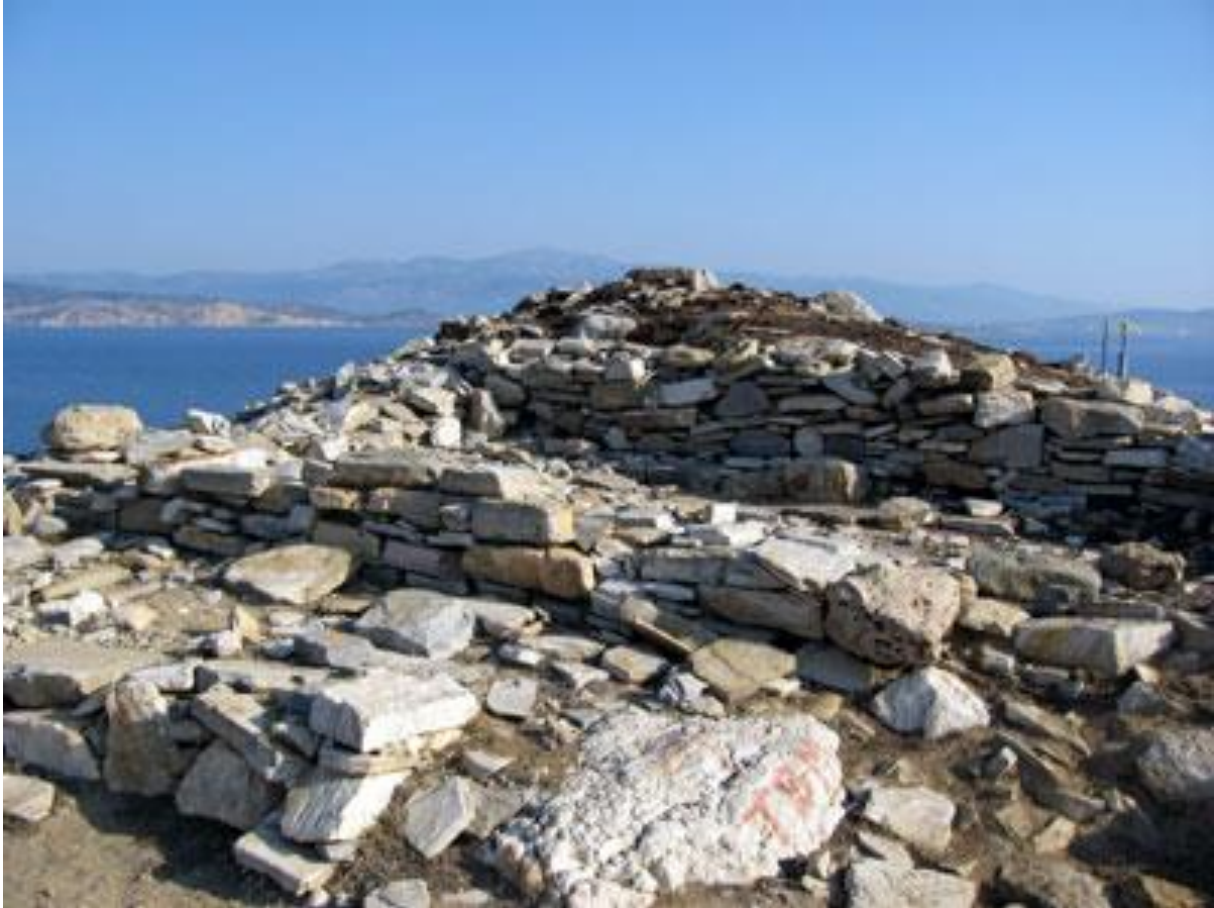
Het kleine eilandje Dhaskalio.

Dhaskalio. De bezoekers arriveren in lange boten (longboats). Ze logeren op een nabijgelegen eilandje genaamd Dhaskalio, dat oorspronkelijk met Keros verbonden is maar van het grotere eiland gescheiden wordt wanneer het waterpeil stijgt. Hier zou een permanente bevolking van 20 mensen verbleven hebben. De groep groeit bij samenkomsten met de afgevaardigden van andere eilanden uit tot wel 400 bezoekers; dat bewijzen de gigantische teruggevonden bouwstructuren op het eilandje. Het zou gaan om 1000 ton steen die zich in een soort piramide op Dhaskalio verheft, dat alles met drainage-tunnels eronder en bewijzen van gevorderde metallurgie. Ik verwijs naar de info over Keros bij Wikipedia voor de bijzondere details betreffende de bebouwing. 5