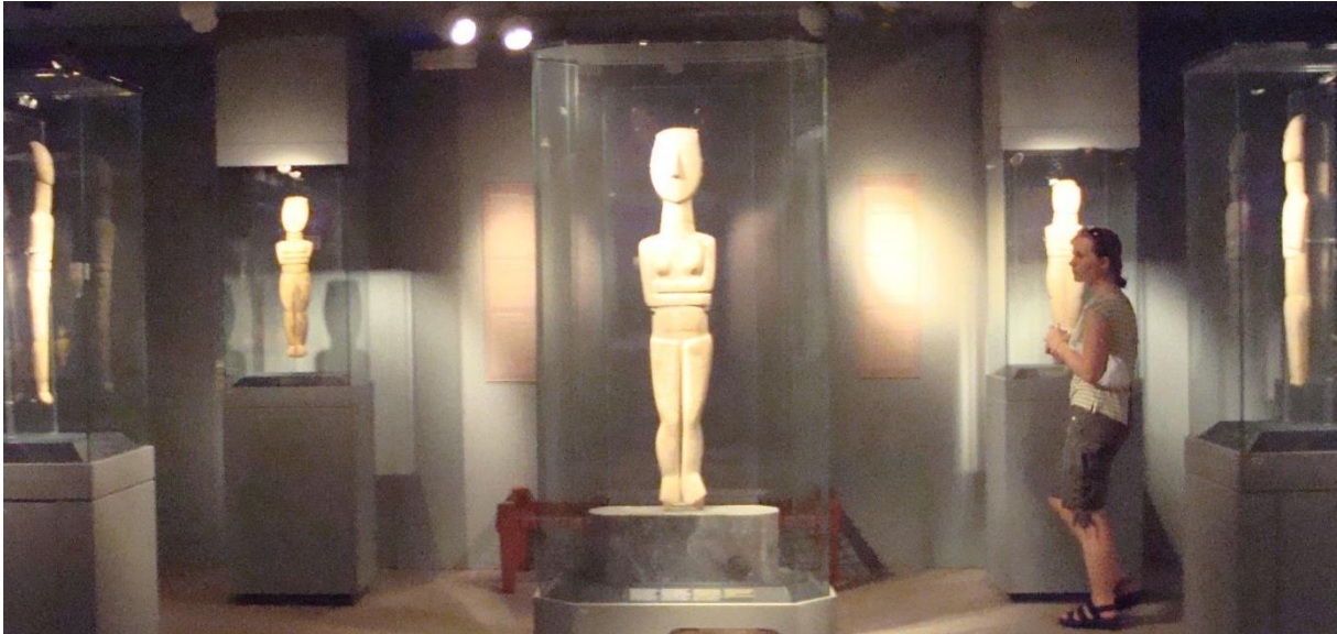
Figurine van 1.40m uit de Spedos-groep met 399 vrouwelijke figurines en 1 mannelijke. Cycladisch Museum Athene, eigen foto. Uit: Venus is geen Vamp 35; The Language of MA 39 [1.2.6ab].

De semi-realistische figurines vallen uiteen in 10 sub-groepen; deze groepen zijn vaak genoemd naar de plaatsen waar ze op de diverse eilanden gevonden zijn. Deze semi-realistische figurines zijn slank en langgerekt. Velen zijn zwanger. Zij zijn voornamelijk in graven gevonden. Een van de subgroepen is de Spedos-groep. Deze groep telt 399 vrouwelijke figurines en één mannelijke. De grootte varieert van maximaal 1,5m tot enkele cm. 1