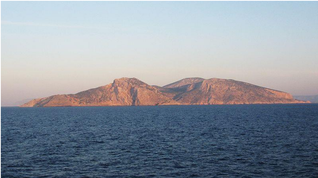
De baarmoederlijke vormen van het eiland Keros

van de vorige eeuw valt de Nordput op Keros ten prooi aan illegale opgravingen en kunstroof; de gebroken figurines worden aan musea en privé-verzamelaars van over de hele wereld doorverkocht.