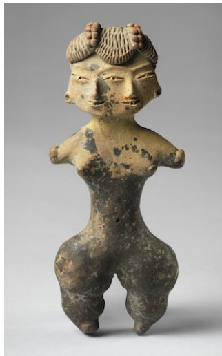
Tlatilco, graf 104, figurine met twee gezichten, 7.9 cm hoog. 10 Er zijn verschillende vrouwelijke figurines met op het onderlichaam- en bovenlichaam twee gezichten. 11

Hoofdzakelijk een vrouwelijk ambacht. Lesure beschouwt vrouwen als de makers en van de figurines en de aardewerken potten; vingerafdrukken uit een cultuur in Arizona uit het eerste millennium AD culture in Arizona, een cultuur in het verlengde van Meso-Amerika, bewijst dat het hoofdzakelijk vrouwen zijn die de kunst creëren. Daarna breidt hij deze conclusie. Hij stelt dat wereldwijd hoofdzakelijk vrouwen de makers zijn van figurines. 9