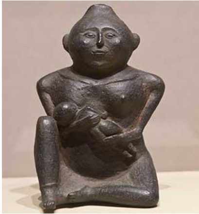
'Moeder en Kind' figurine.

De (vrouwelijke) 'Keller figurine'. Begeleidende tekst bij de boekbespreking van Everding: The Keller figurine, one of several flint-clay statues from the Mississippian mound-building culture unearthed near Cahokia Mounds, was once seen by some scholars as a "corn goddess" sitting on a row of corn cobs.. Zie ook Max Dashu over 'Keller-figurine' onder de link https://www.suppressedhistories.net/Gallery/mississippia.html