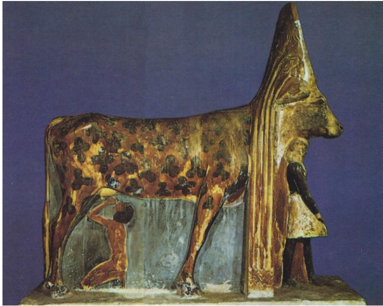
Egypte, Moederkoe Hathor zoogt de farao, 15 e eeuw v. Chr. Zie The Language of MA p. 384 [II.3.50]

Naar aanleiding van de studiedag Ave Eva in Groningen op 28 januari 2017 kreeg ik het verzoek om een stukje te schrijven over de heiligheid van de koe. Direct heb ik de daad bij het woord gevoegd en schreef op verzoek het volgende stukje.