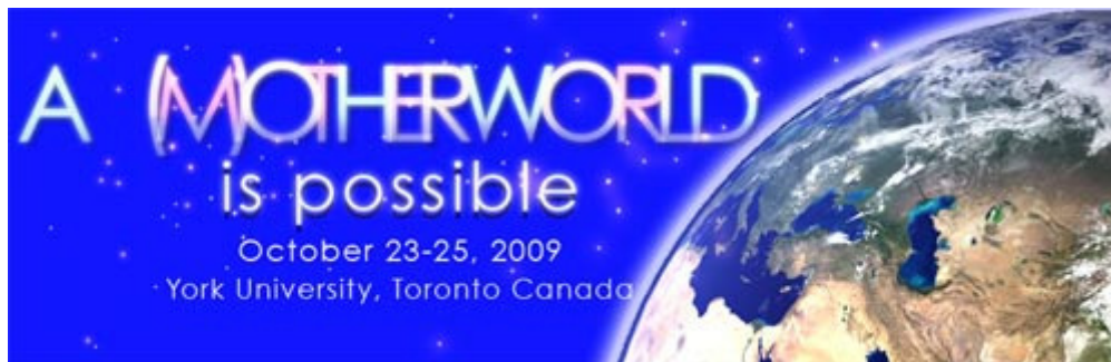
A (M)Otherworld is Possible: Two Feminist Visions