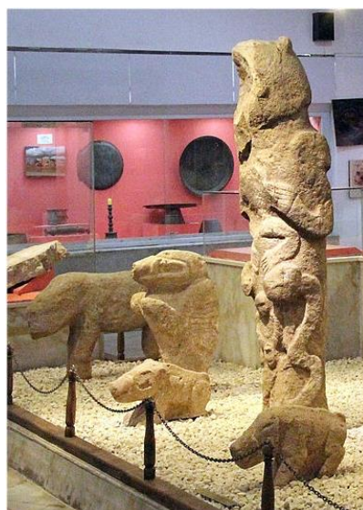
Foto uit 2012 uit het reisverslag van Lydia Ruyle uit het verbouwde museum met de zg 'totempaal'

'The Sanliurfa Museum titles this large statue a male. Miriam Robbins Dexter and Victor Mair describe her as a "displaying female image". There is a hole under the hands holding the labia which has traces of red ochre on the stone indicating ritual use. On the T-shaped pillar, the belt under the hands can be read as a U-shaped yoni with labia, arrow pointing to labia, or it can be read as testicles and penis. What do you see? The V shaped adornment on the chest can be seen on female stone figures in Neolithic Europe. The humans who built Göbekli Tepe invested massive energies and resources to create large rock cut circular structures. The pillars themselves seem to indicate a human body with a T shaped head. Some of the pillars have bas reliefs of animals, birds and insects carved on them. Some of them wear belts. What do the structures tell us about the culture? What do they mean? One interpretation I would suggest is that the stone circles on Navel Mountain were a structural metaphor for birth and rebirth to continue the cycle of life. Since birth is a process only experienced by women, it seems obvious to me that Gobekli Tepe represents birth'.