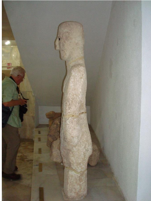
Het beeld in de oude opstelling van het museum te Sanliurfa in 2007, eigen foto.

Is het grote beeld uit Sanliurfa mannelijk? De archeoloog Klaus Schmidt – hij leidt aanvankelijk de opgraving bij Göbekli maar overlijdt helaas in 2014; ik ontmoet hem in 2007 op de opgraving – beschrijft in zijn boek 'Sie bauten die erste Tempel' uit 2006 het beeld als een 'man', die duidelijk zichtbaar de handen op de fallus houdt'. 2 Het beeld lijkt een masker te dragen en toont grote zwarte ogen. De dubbele V-vorm bij de hals van een ketting of kleding en de gordel met gesp met de naar beneden afhangende dierhuiden plus daar weer onder de holte die met rode oker gevuld is, zijn symbolen van het vrouwelijke. Daarnaast houdt het beeld de handen op de onderbuik bij die holte, een sacraal-vrouwelijke houding, met aandacht voor de baarmoeder, van waaruit nieuw leven gebaard en geboren wordt.