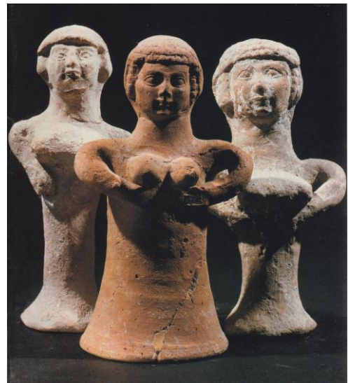
Ashera van Israël

Die eerste joodse en hellenistische christenen zagen Maria niet als aardse moeder van de mens Jezus maar als Almoeder die de Zoon gebaard had, in de christelijke traditie 'de Christus' genaamd. Christus als Eerstgeborene van het eerste kosmische mannelijke en vrouwelijke oerpaar. En dat ontzag voor Sophia en Maria als de Moeder Gods en Moeder van de Zoon werkt tot op de dag van vandaag door in postcommunistisch Rusland. En buiten de Russisch-orthodoxe kerk is er ook nog de Grieks-orthodoxe kerk met de grote verering voor Maria als Panagia of Alheilige.