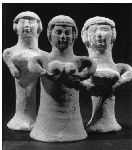
Ashera van Israël

Welbekend is het feit dat het Hebreeuwse volk rond 1200 v. Chr. in de zogenaamde Uittocht of Exodus het oude land Egypte verliet. Het nam uit Egypte mét het oermonotheïsme én de oude mysterietraditie ook de oerdrieheid van Moeder-Vader-Kind (Isis-Osiris-Horus) mee. In de tempel te Jeruzalem was er plaats voor dit goddelijke oer-gezin. Vrouwe Wijsheid is in de teksten alom aanwezig als vrouwelijke oerkracht die samen met het mannelijke scheidt. Als een bouwmeester of architect brengt zij het geschapene in structuur en geeft het vorm. Ik gaf meerdere tekstvoorbeelden in mijn boek Van Sophia tot Maria uit 2008 (131).