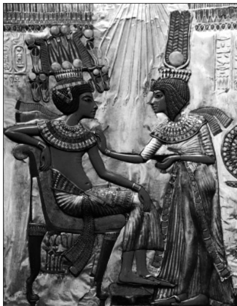
De Egyptische koningin Ankh-Esenamun zalft koning Tut-Ankh-Amon, c. 1380 v. Chr.